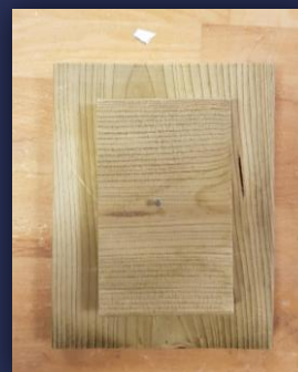
Dakje van het nestkastje