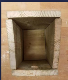
Boven aanzicht nestkastje